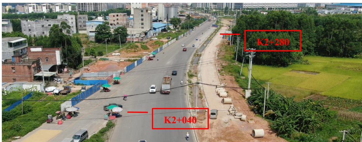
K2+040~K2+280 现状图（拍摄时间 2022 年 7 月 1 日）