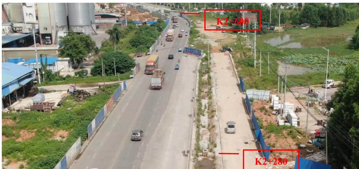
K2+280~K2+600 现状图（拍摄时间 2022 年 7 月 1 日）