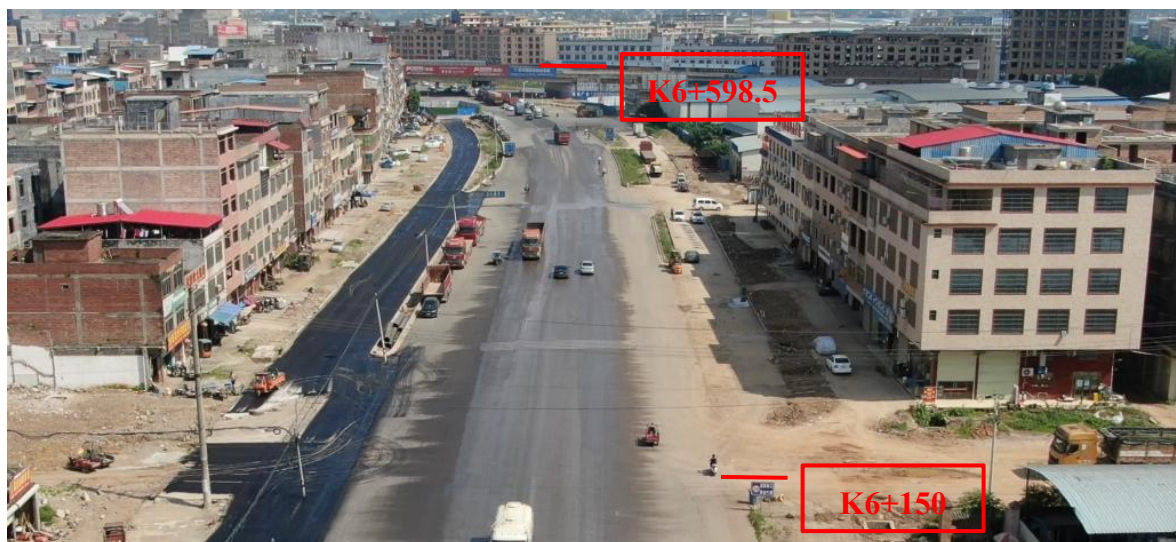
K6+150~K6+598.5 现状图（拍摄时间 2022 年 7 月 1 日）