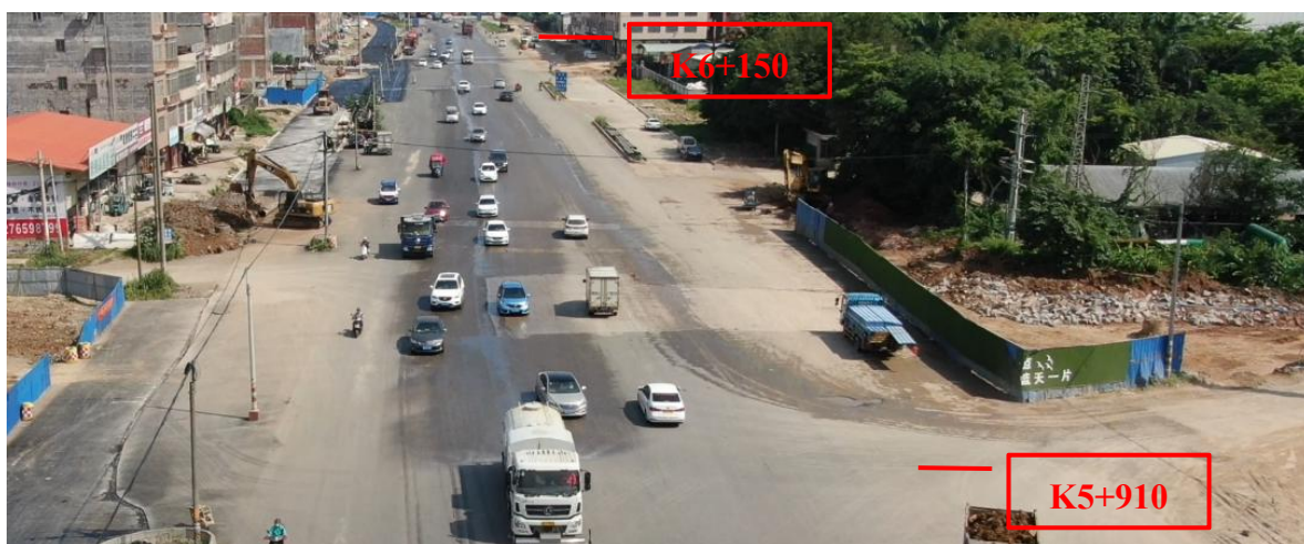
K5+910~K6+150 现状图（拍摄时间 2022 年 7 月 1 日）