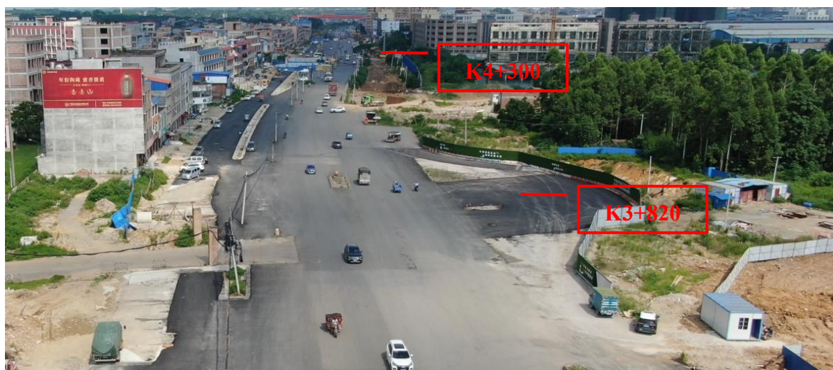
K3+820~K4+300 现状图（拍摄时间 2022 年 7 月 1 日）