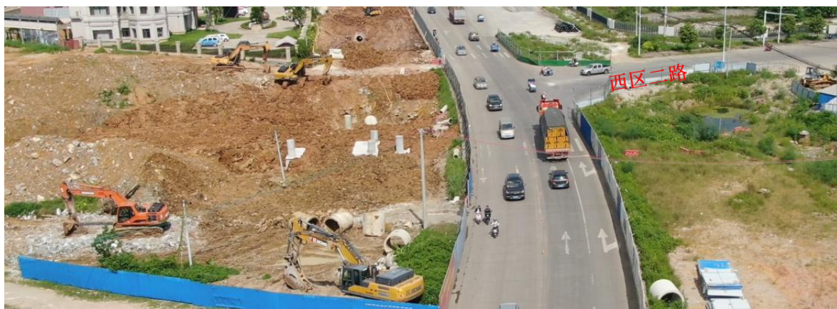
与西区二路衔接口现状图（拍摄时间 2022 年 7 月 1 日）