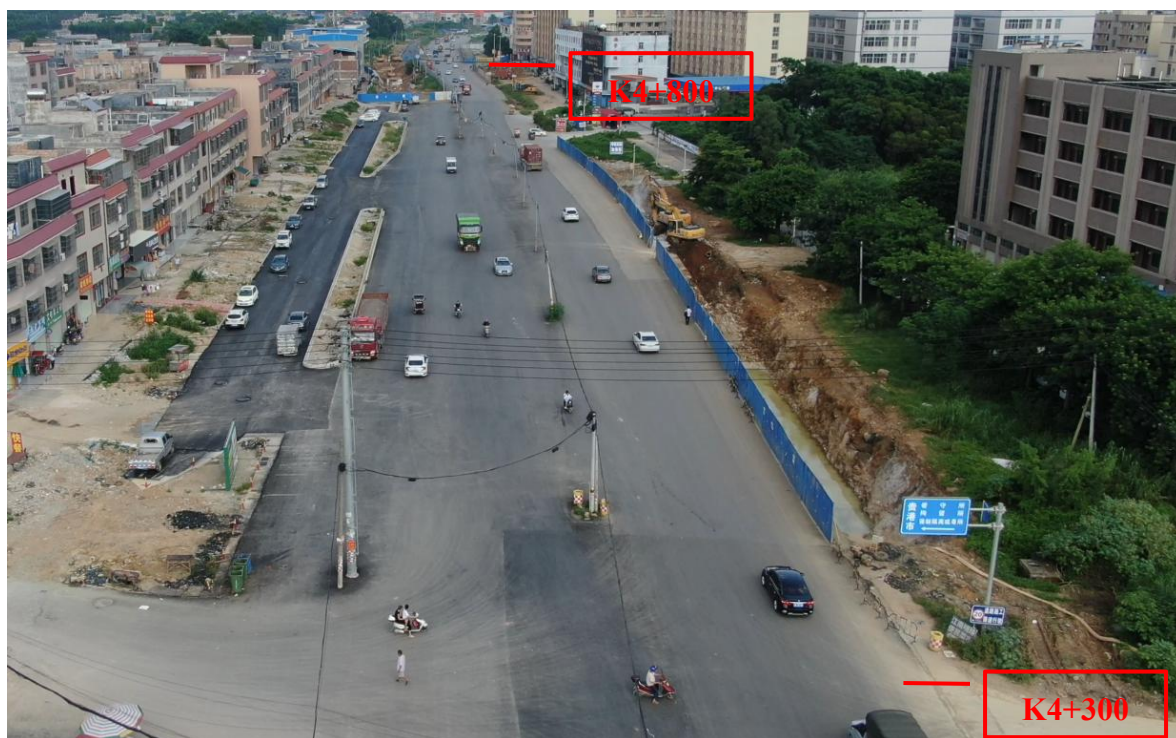
K4+300~K4+800 现状图（拍摄时间 2022 年 7 月 1 日）