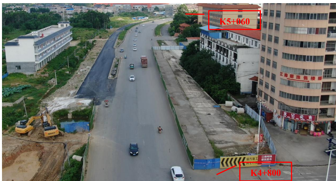
K4+800~K5+060 现状图（拍摄时间 2022 年 7 月 1 日）