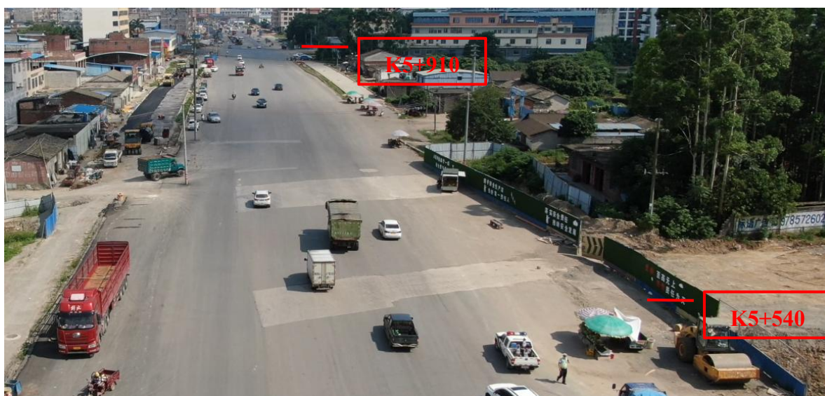
K5+540~K5+910 现状图（拍摄时间 2022 年 7 月 1 日）