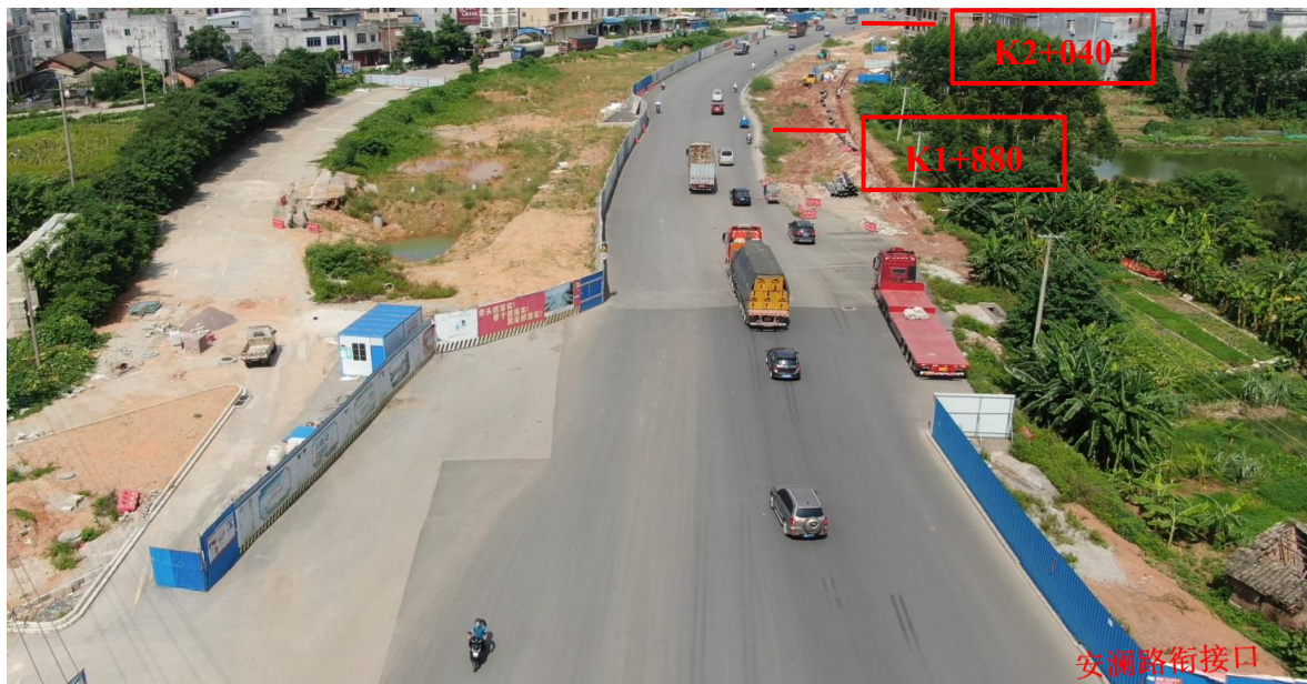
K1+880~K2+040 现状图（拍摄时间 2022 年 7 月 1 日）