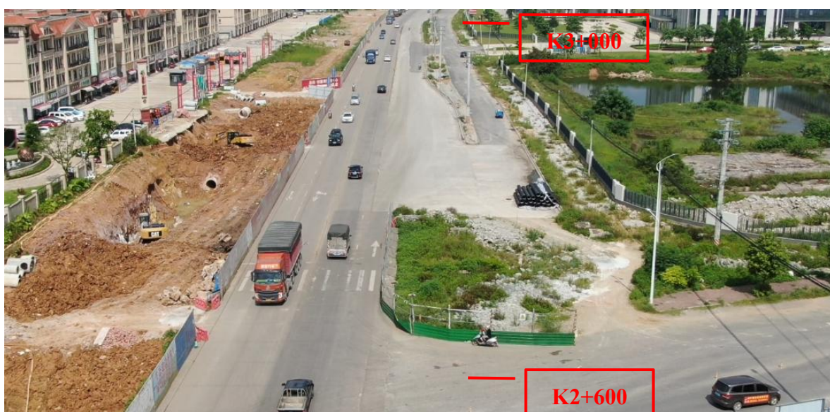
K2+600~K3+000 现状图（拍摄时间 2022 年 7 月 1 日）