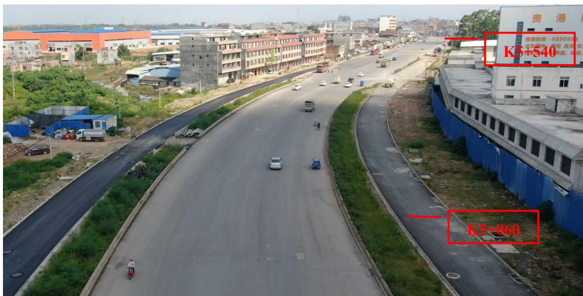
K5+060~K5+540 现状图（拍摄时间 2022 年 7 月 1 日）