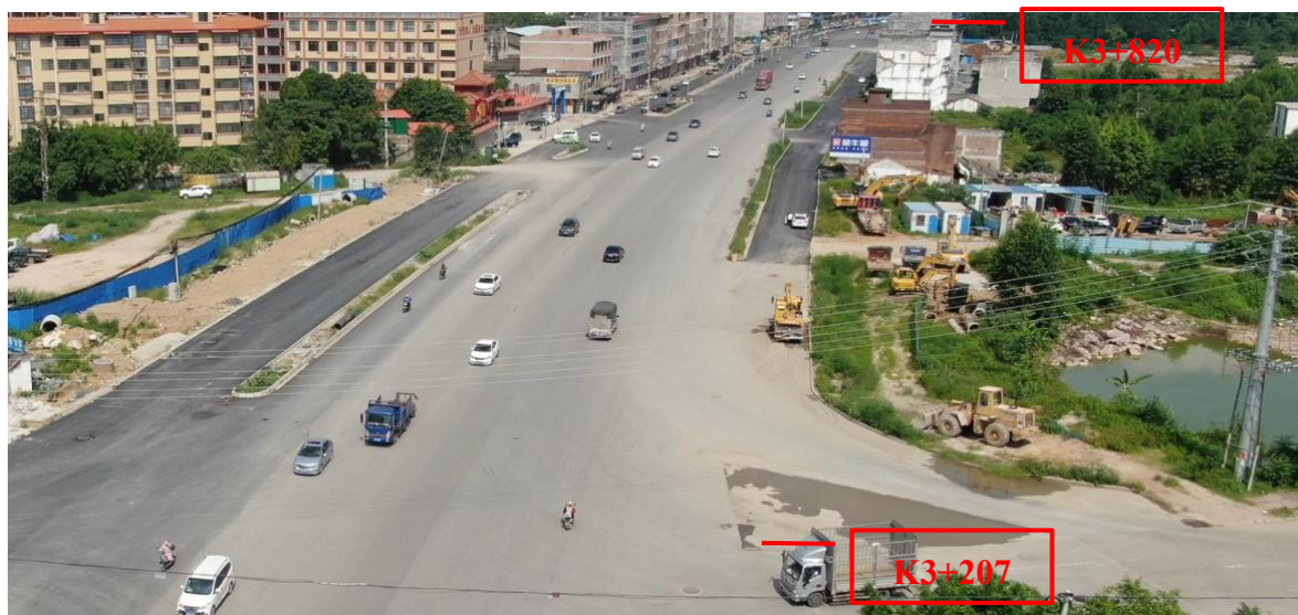
K3+207~K3+820 现状图（拍摄时间 2022 年 7 月 1 日）