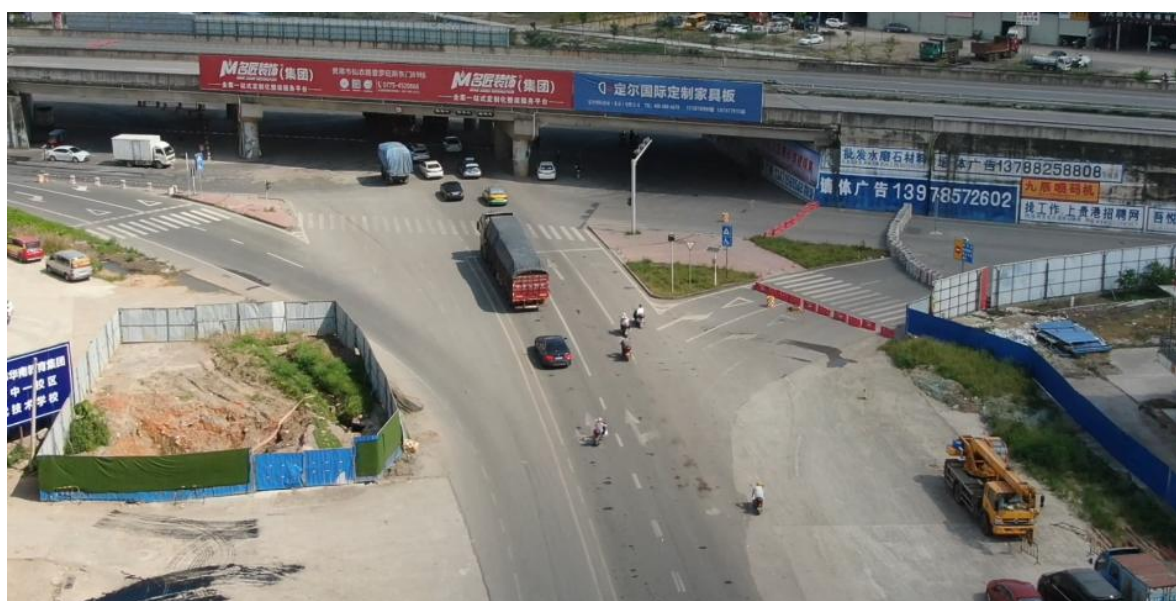
衔接南环路现状图（拍摄时间 2022 年 7 月 1 日）